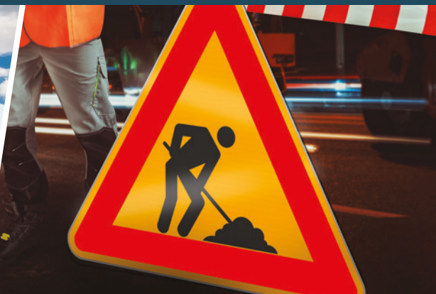
SCRITTE E GRAFICHE