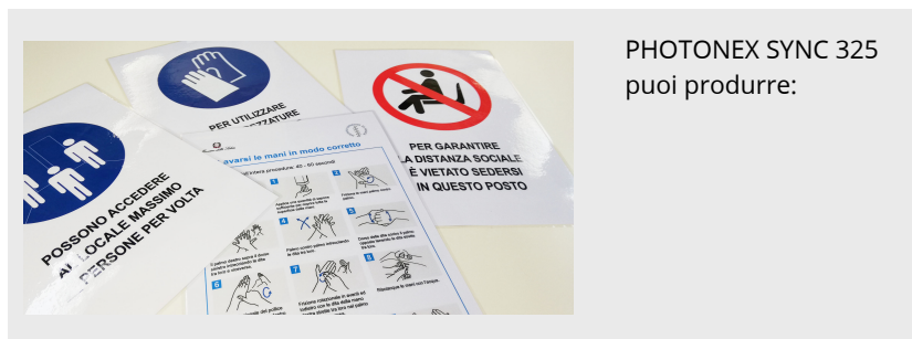
PHOTONEX SYNC 325 puoi produrre: